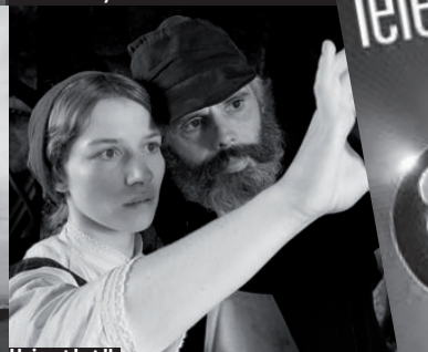
Heimat I et II