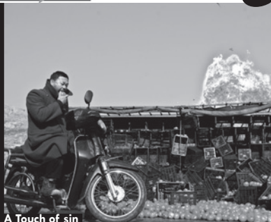
A Touch of sin

Cinéma LE CRATÈRE 95 grand rue Saint Michel - 31400 TOULOUSE - 05 61 53 50 53