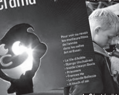
Le Géant égoïste