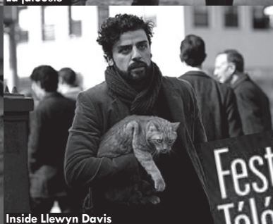
Inside Llewyn Davis