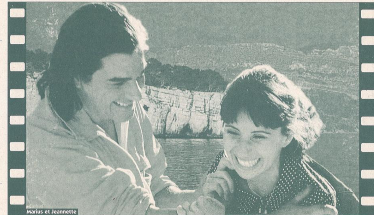
Marius et Jeannette

95 grand rue saint Michel 31400 Toulouse 05 61 53 50 53 : Répondeur vocal 05 62 27 91 10 : Pour tous renseignements et demandes de séances spéciales (écoles, centres de loisirs etc.)