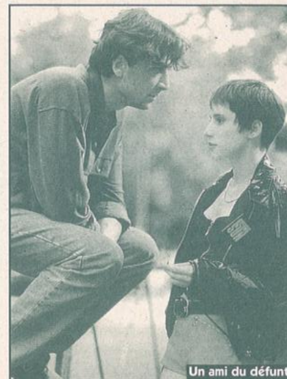
Un ami du défunt