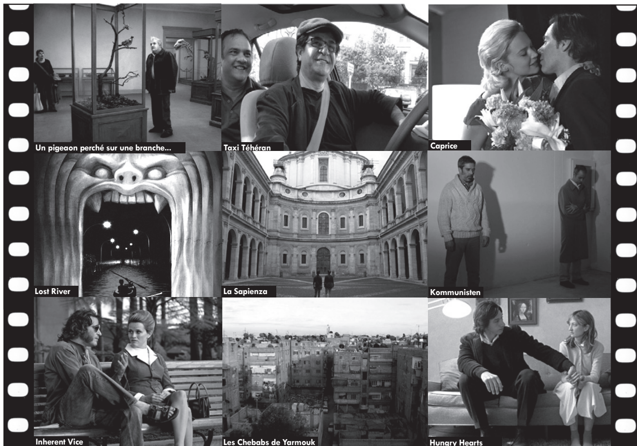
Un pigeon perché sur une branche...

Cinéma LE CRATERE 95 grand rue Saint Michel - 31400 TOULOUSE - 05 61 53 50 53