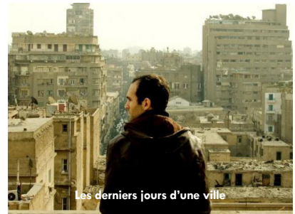
Les derniers jours d'une ville