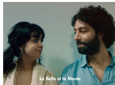
La Belle et la Meute