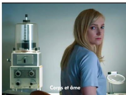
Corps et âme