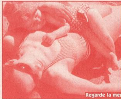
Regarde la mer