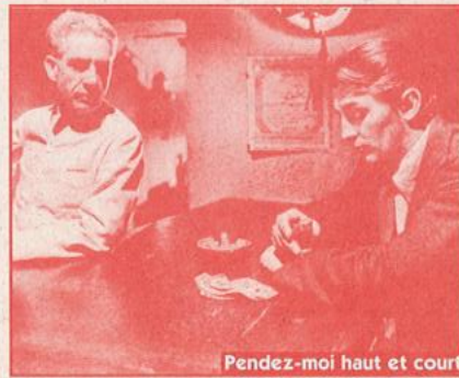
Pendez-moi haut et court