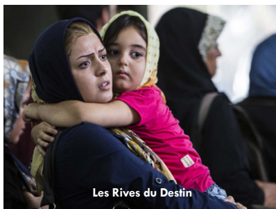
Les Rives du Destin