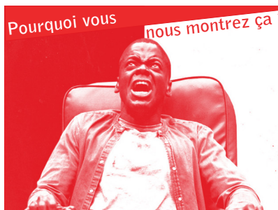
Pourquoi vous nous montrez ça ?