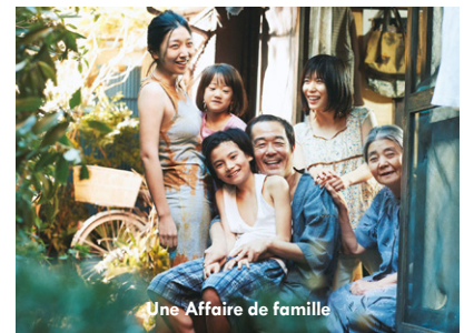
Une Affaire de famille