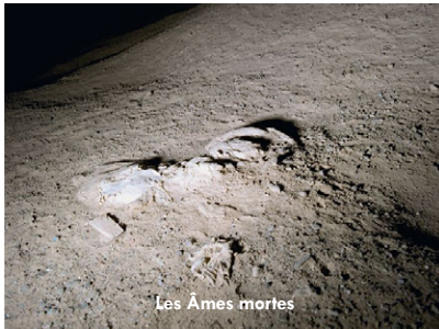
Les Âmes mortes

Salle Art & Essai - Recherche & Découverte - 95 Grand-rue Saint-Michel 31400 Toulouse - www.cinemalecratere.com