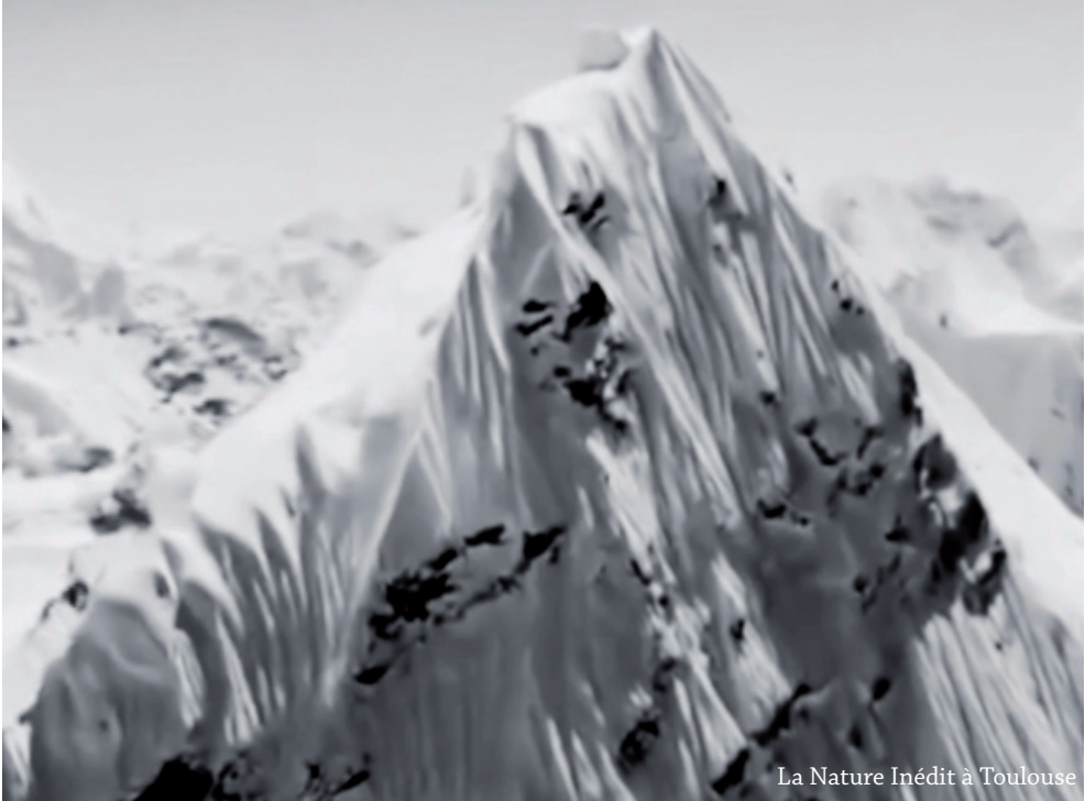
La Nature Inédit à Toulouse

Programme n°219 du 20 avril au 24 mai 2022