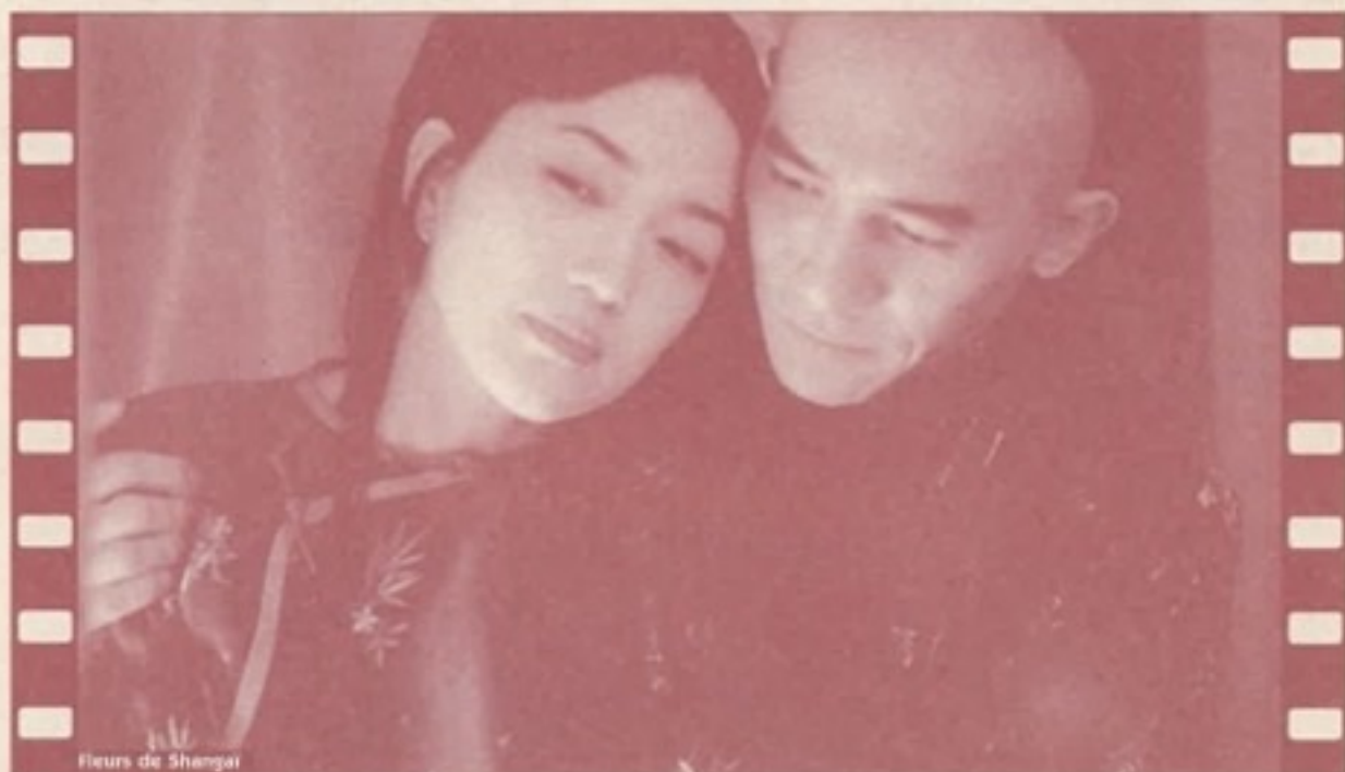
Fleurs de Shanghai