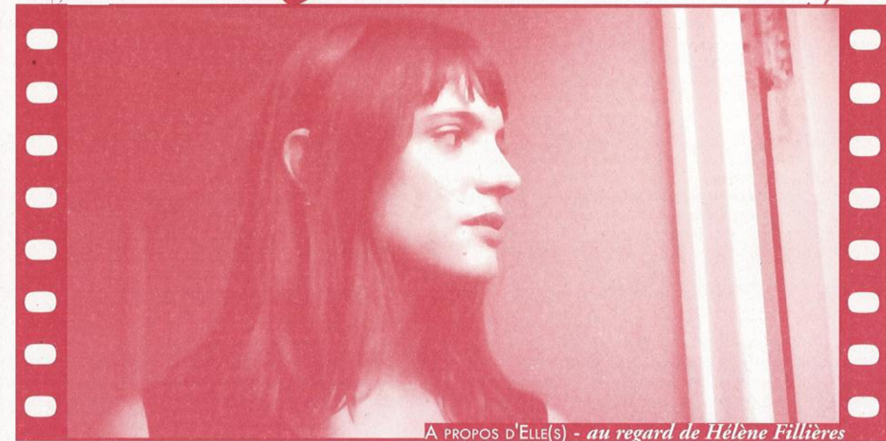
A PROPOS D'ELLE(S) - au regard de Hélène Fillières